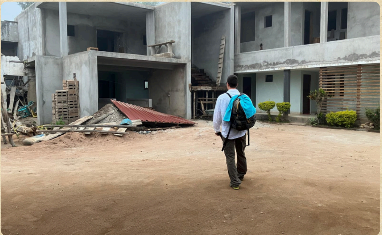
Il nostro álbergo work in progress a Maganja