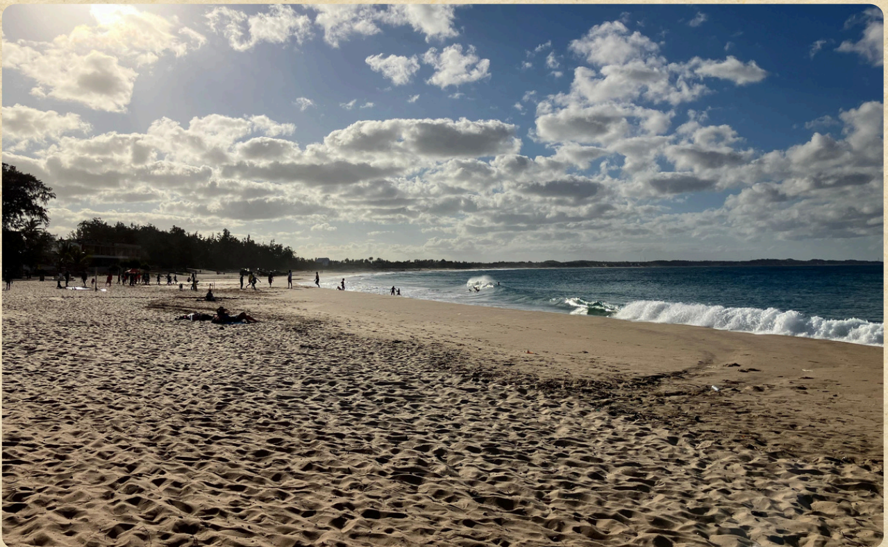
La spiaggia di Tofo