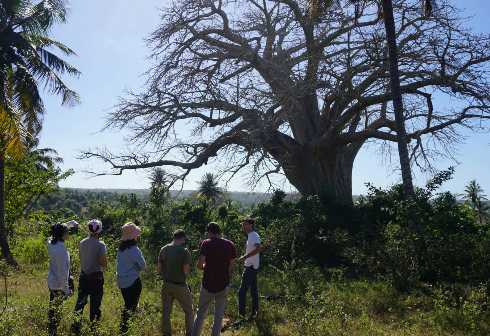
Sopra: il baobab di Mocodoene: “il vero dono di questa comunità”