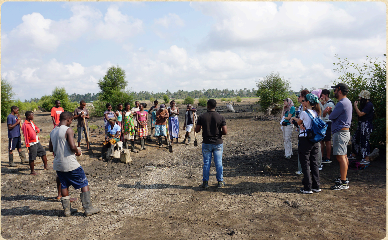
Incontro con gli abitanti di Inhangome che si occupano della riforestazione di mangrovie