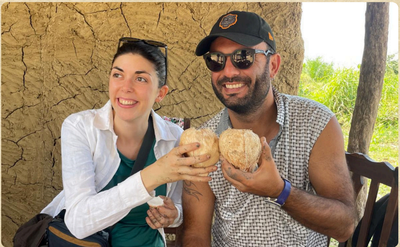
Brindisi con latte di lanho, un cocco ancora acerbo