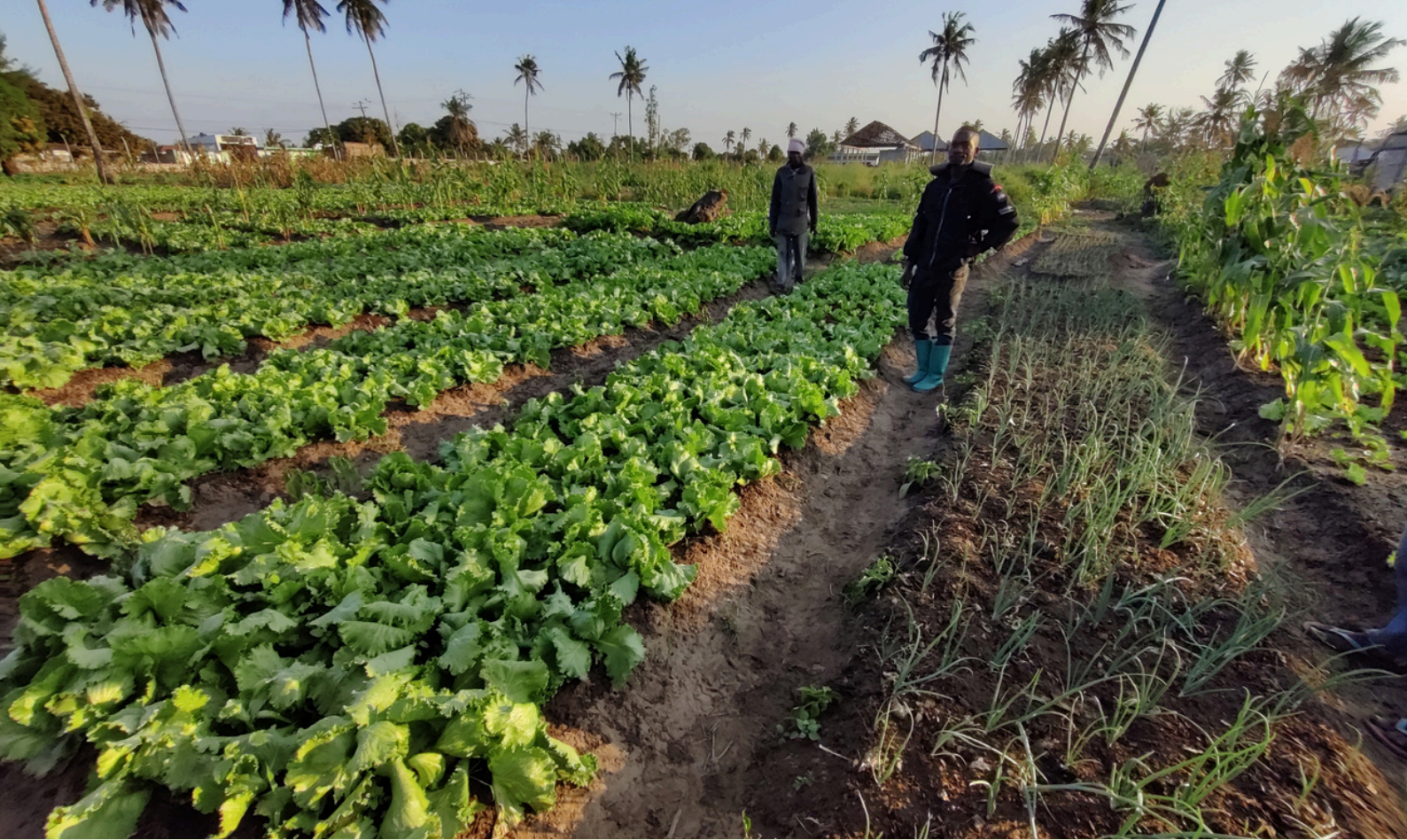
Sopra: il tecnico Osifo negli orti urbani di Quelimane