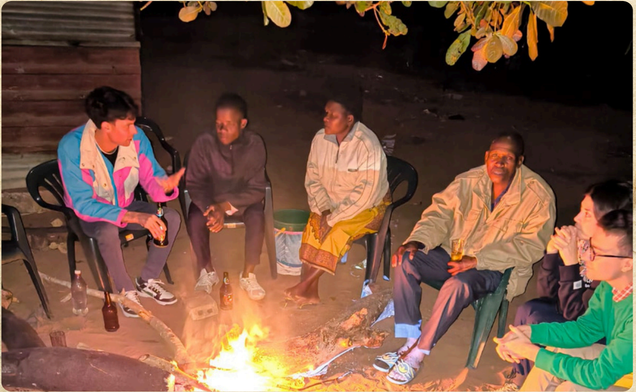
Intorno al falò ad ascoltare storie di vita