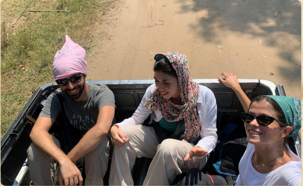
Viaggiatori sul cassone del pick-up